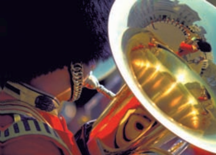
Помпезный церемониал перед Букингемским дворцом

дон, густонаселенный и загрязненный». Сегодня благодаря специальной системе штрафов (congestion charge), согласно которой с водителей частных автомобилей взимается высокая плата при въезде на определенные территории (главным образом в центре в промежутке от 7.00 до 18.00 с понедельника по пятницу), количество машин на улицах Лондона заметно сократилось. Таким образом власти надеются решить проблему загазованности города.