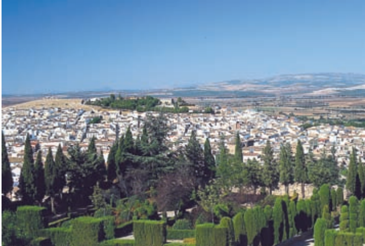
Ландшафт Андалусии вокруг древнего городка Антекера в горах к северу от Малаги

во всем мире. Это и Севилья, знаменитая боями быков и фламенко, и первая столица исламской Испании Кордова, и Гранада, столица последнего исламского халифата на Пиренейском полуострове и место расположения величественного дворца Альгамбра. Там же вы обнаружите Херес-де-ла-Фронтеру, мировой центр производства хереса, Ронду с ее потрясающим ущельем и ареной для боя быков XVIII в. и Кадис, который считается старейшим городом Испании. Пейзаж внутренних районов усеян многочисленными «белыми деревнями» ( pueblos blancos ).