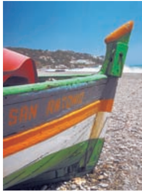
Традиционная рыбацкая лодка

Еще дальше вырастает и безраздельно доминирует на фоне неба знакомый силуэт Гибралтарской скалы. Если